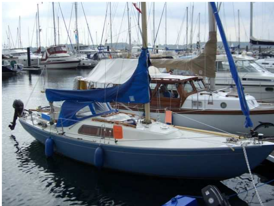
Internationales Folkeboot, Werft Marieholm 1970